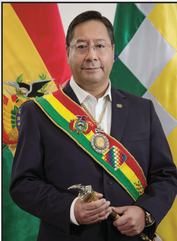
Luis Arce Catacora Presidente del Estado Plurinacional de Bolivia