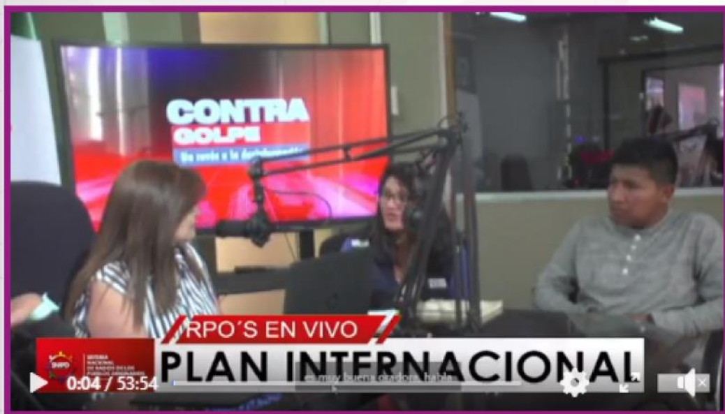
Programa de Radio: ACTUAR PARA TRANSFORMAR

Otros formatos de producción como: cuñas, micro programas, micro informativos, capsulas, flashes informativos, en diferentes idiomas (castellano, aymara).